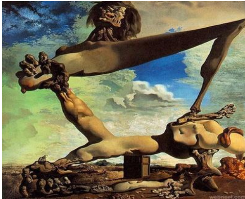
1-Salvador Dali, Premonition of Civil War , 1936 Bride.1940