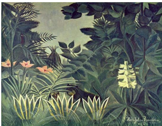
3. Henri Rousseau . The Equatorial Jungle ,1909 Oil on canvas , Manifeste du surréalisme