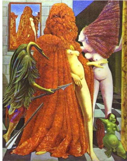
2. Max Ernst. The Robbing of the Bride .1940